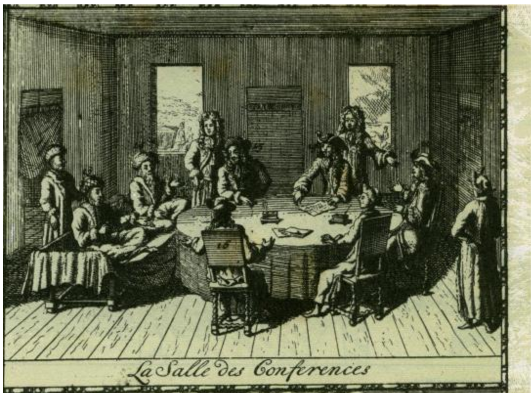
De Vrede van Karlowitz. Links de Turken, rechts de afvaardiging van een lid van de Liga, en in het midden de bemiddelaars. Iedere partij had zijn eigen ingang.