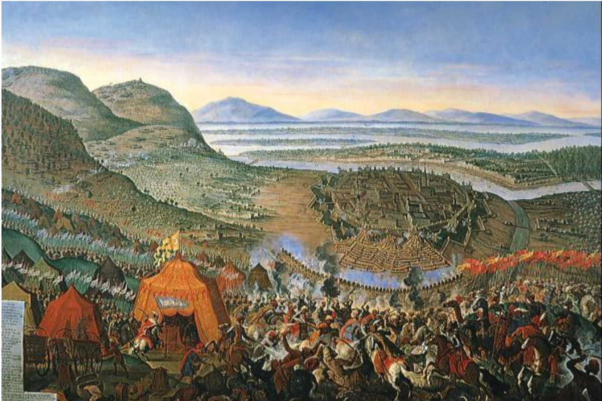
De Ottomanen omsingelen Wenen. Schilderij van Frans Geffels (1635–1671) - Badisches Landesmuseum.

trokken zich terug naar Hongarije. Kara Mustafa werd uit zijn ambt gezet en in december ter dood veroordeeld. Toen hij in Belgrado aankwam, ontving hij van de sultan een pakje met een zwarte zijden sjaal. Hij wist wat dat betekende: een bevel om zichzelf op te hangen. De nipte redding van Wenen door de Poolse koning bracht de Europese leiders tot het inzicht, dat ze alleen gezamenlijk de Turken konden verslaan. Daarom werd in het voorjaar van 1684 de Heilige Alliantie opgericht. Deze Heilige Alliantie bestond uit Polen, het Heilige Roomse Rijk, Venetië, Toscane, Rusland en Malta.